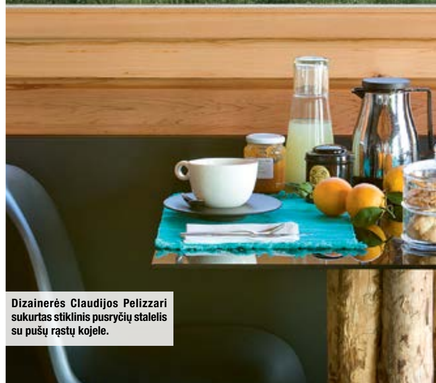
Dizainerės Claudijos Pelizzari sukurtas stiklinis pusryčių staliukas su pušų rąstų kojele.