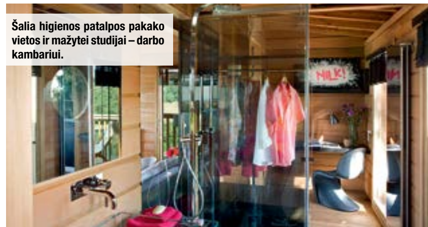
Šalia higienos patalpos pakako vietos ir mažytei studijai – darbo kambariui.