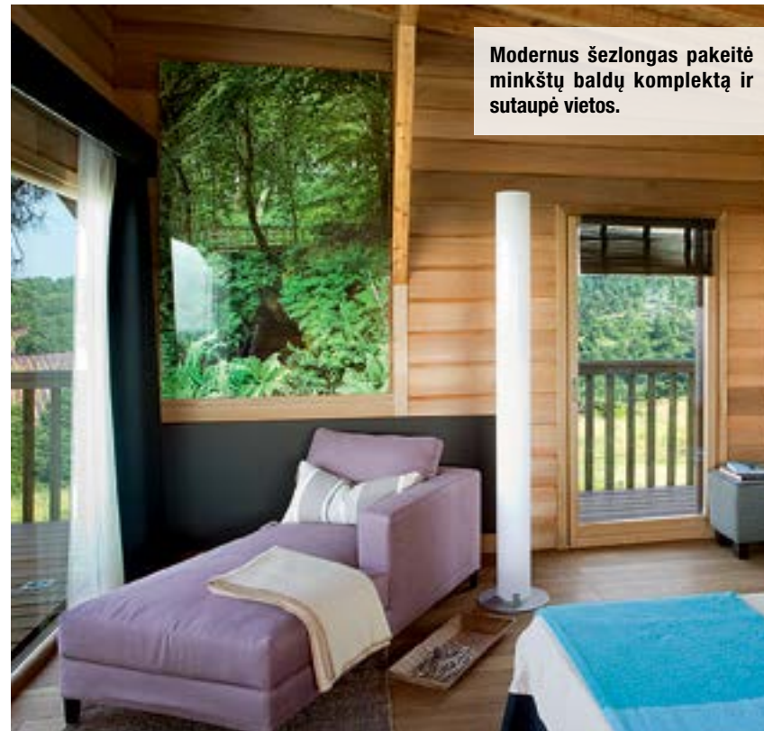
Modernus šezlongas pakeitė minkštų baldų komplektą ir sutaupė vietos.

Šis namelis medyje yra taip pritaikytas prie esamo medžio struktūros, kad didžiulė dviejų šimtų metų senumo pušis liko visiškai nepaliesta: į medį neįkalta nė vienos vinies... Negana to: medis yra prižiūrimas specialistų, o nuo žaibo jį saugo specialiai sukurtas magnetinis laukas.