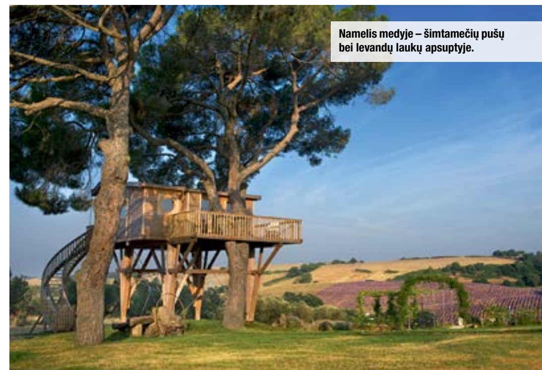
Namelis medyje – šimtamečių pušų bei levandų laukų apsuptyje.