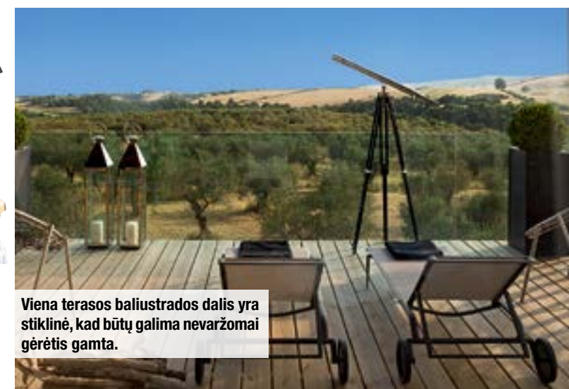
Viena terasos baliustrados dalis yra stiklinė, kad būtų galima nevaržomai gėrėtis gamta.